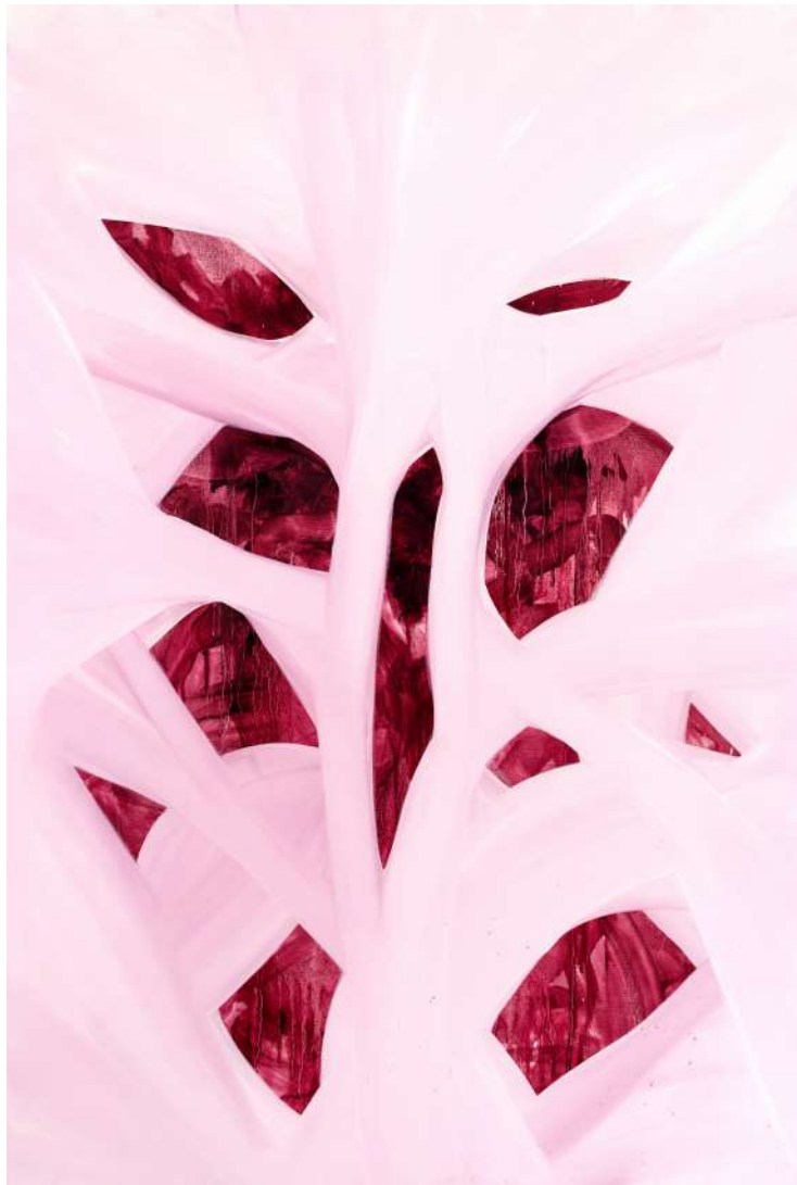
Latissimus dorsi II ulje na platnu 150 x 100cm 2023.