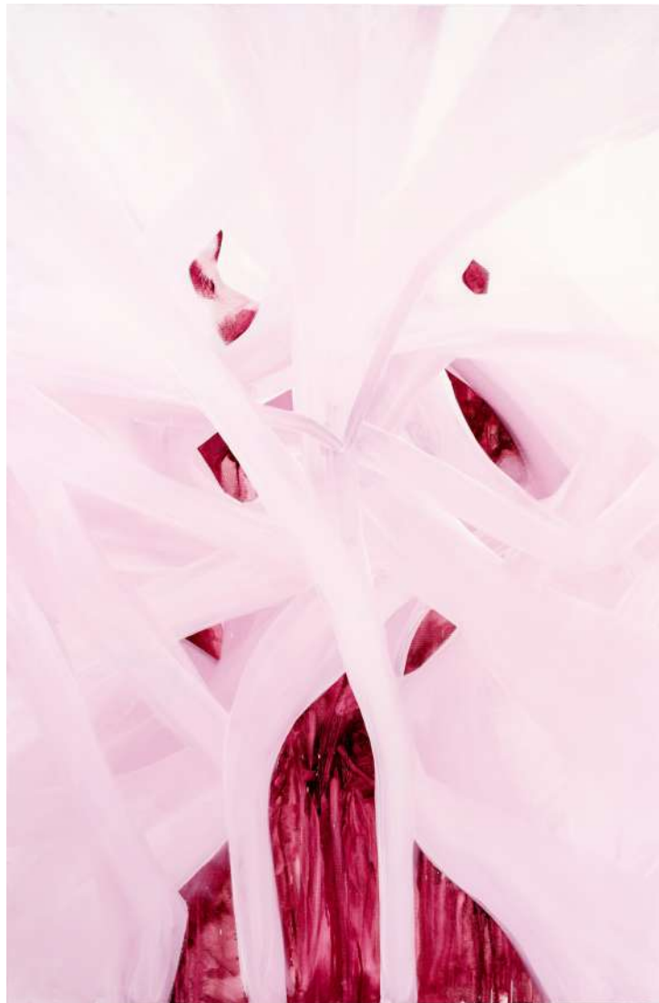
Latissimus dorsi III ulje na platnu 150 x 100cm 2023.