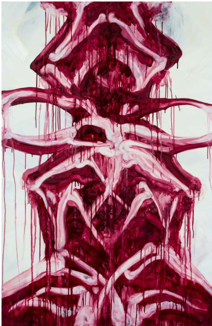
Myocardium I ulje na platnu 150 x 100cm 2023.