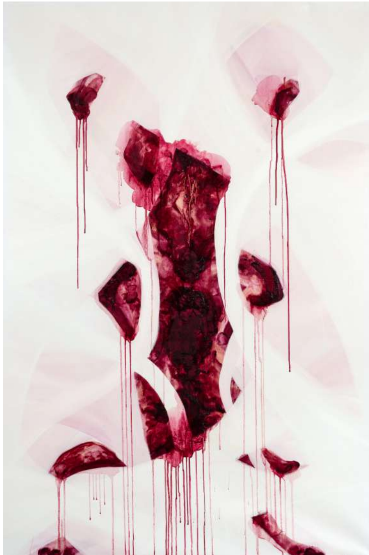
Pectoralis I ulje na platnu 150 x 100cm, 2023.