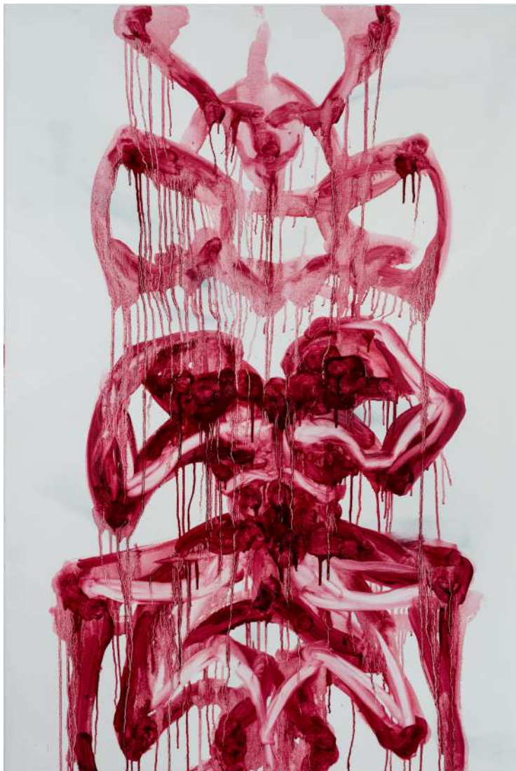
Myocardium II ulje na platnu 150 x 100cm 2023.