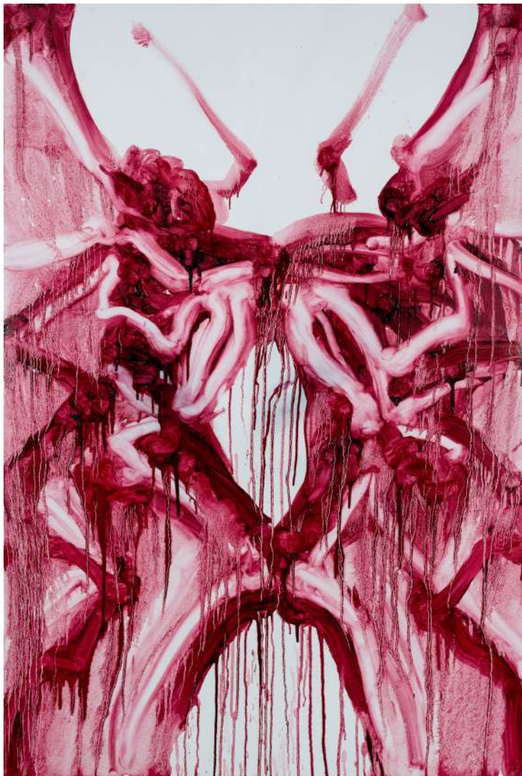
Linea alba I ulje na platnu 150 x 100cm 2023.