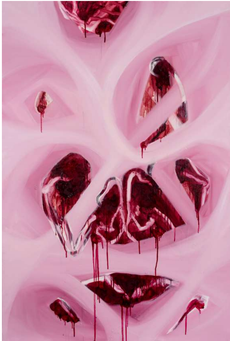
Sartorius II ulje na platnu 150 x 100cm 2023.